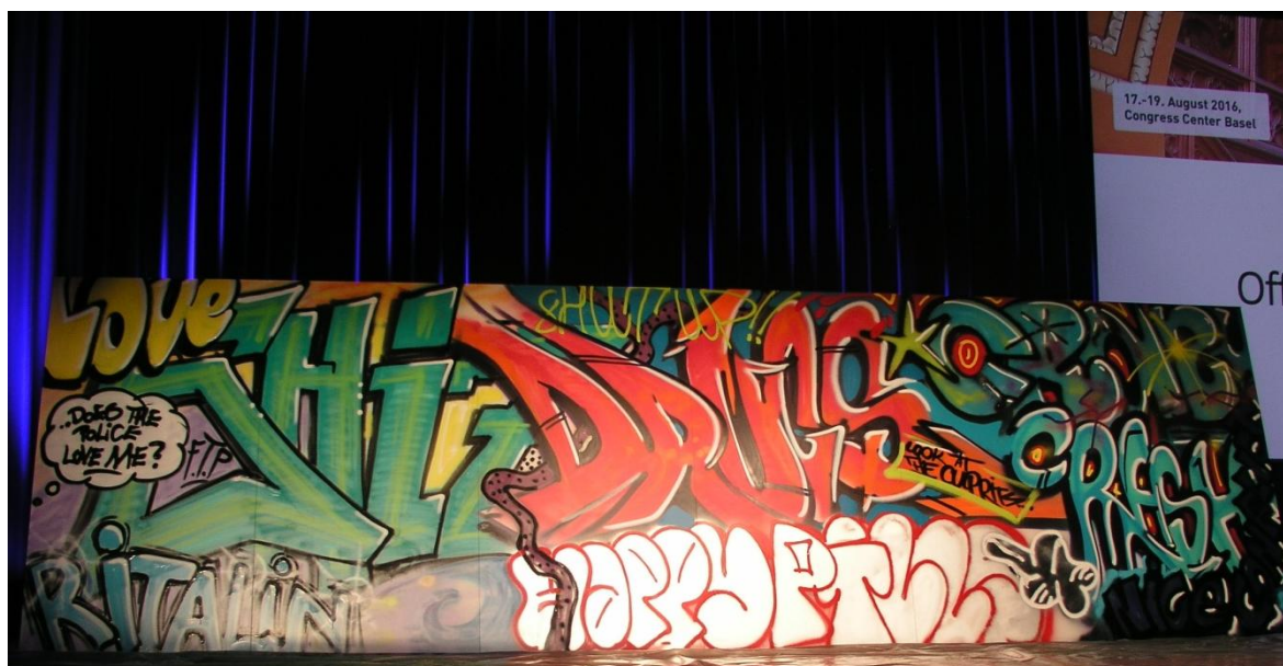
Impression des Kongresses