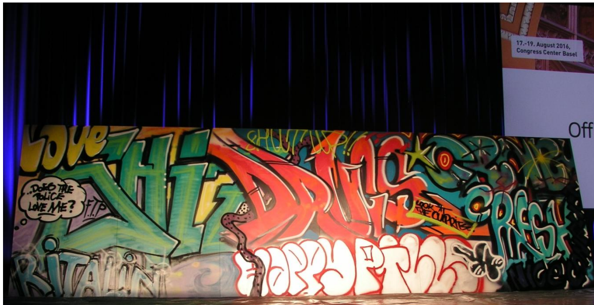
Impression du congrès